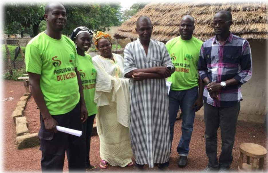
Visite de plaidoyer chez l'Imam et la "Badienou Gokh" au de poste de santé de Oubadji (DS Saraya)