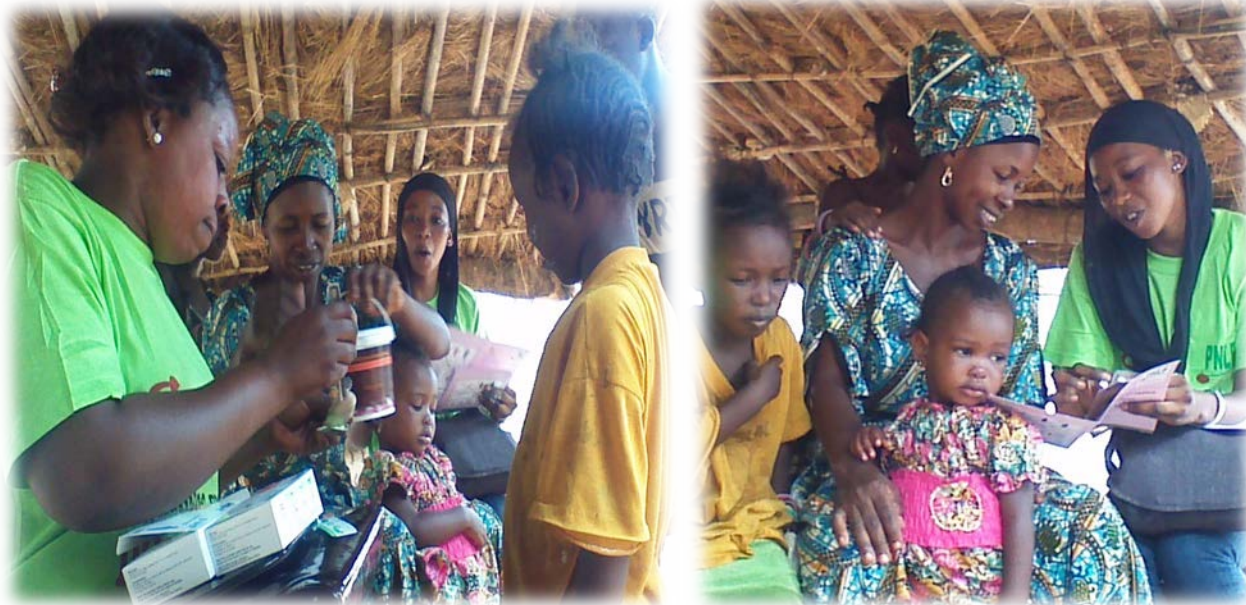
Administration des médicaments dans une famille à Togoro. Communication avec la maman pour l'administration des doses du J2 et J3 et le remplissage de la carte CPS (commune de Kédougou)