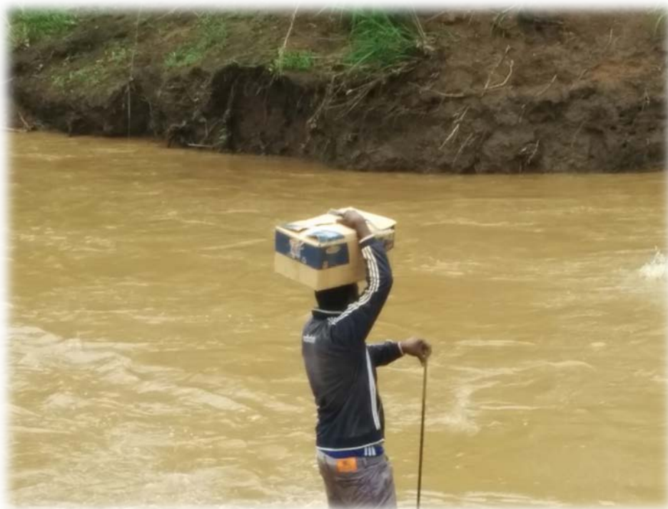
L'infirmier chef de poste de Saroudia (DS SARAYA) transportant les intrants de la CPS sous les eaux